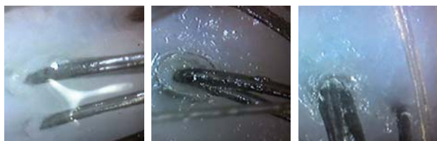
OBSERWACJA: 10-15 min po aplikacji trichoblokera (film ochronny - skóra, włos)

Od początku zaobserwowania problemu, w codziennej styczności ze skutkami chemii fryzjerskiej obserwowanej